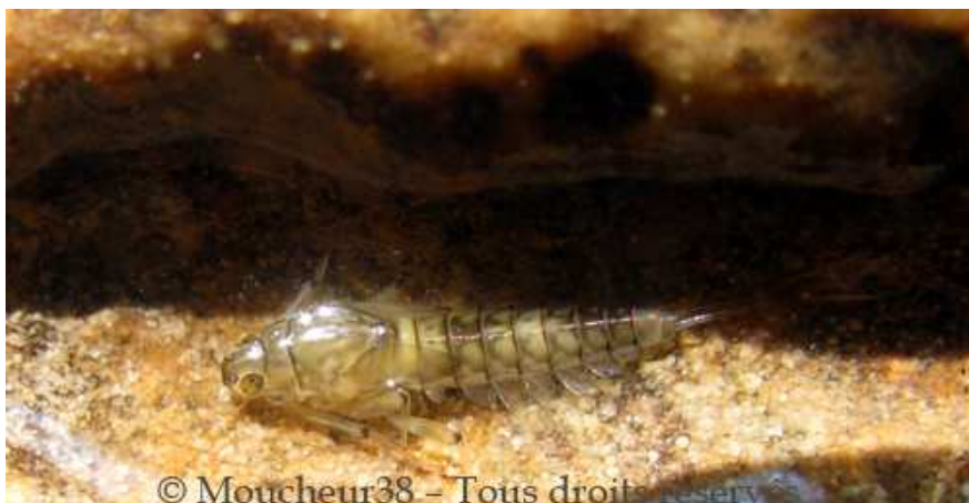
NYMPHE DE BAËTIS